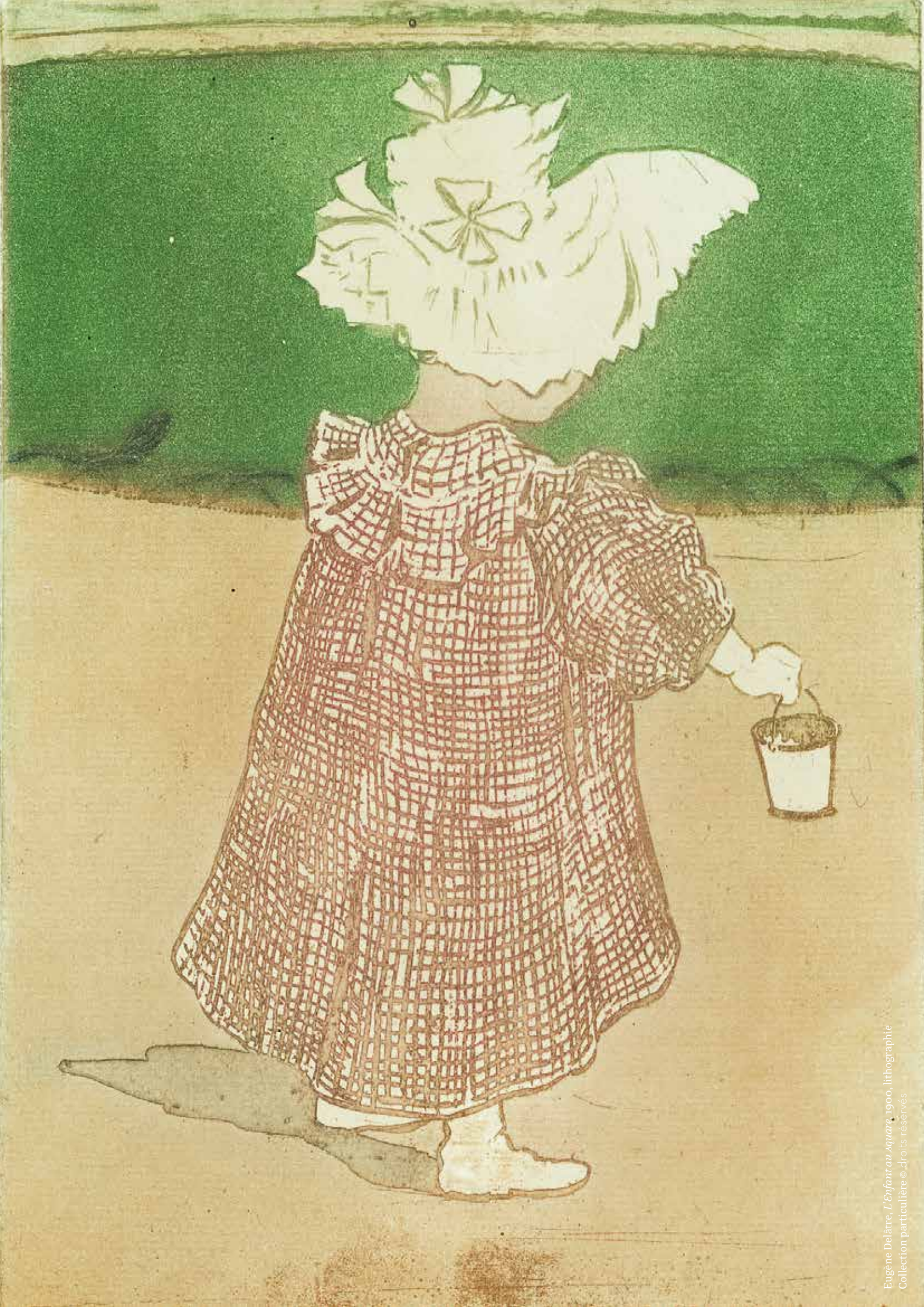
Eugène Delâtre, L'Enfant au seau , 1900, lithographie Collection particulière