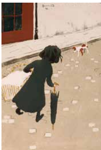
Pierre Bonnard, La Petite blanchisseuse , 1896 Lithographie

National Gallery of Art, Whashington - Collection Ailsa Mellon Bruce