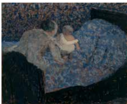
Édouard Vuillard, Grand-mère et enfant au lit bleu, 1899, huile sur carton Kunstmuseum Winterthur Acquis grâce aux fonds de la Jubilee Foundation Kunstverein Winterthur, 2010