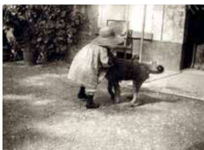
Pierre Bonnard, Renée embrassant un chien , 1898, Musée Bonnard, Le Cannet