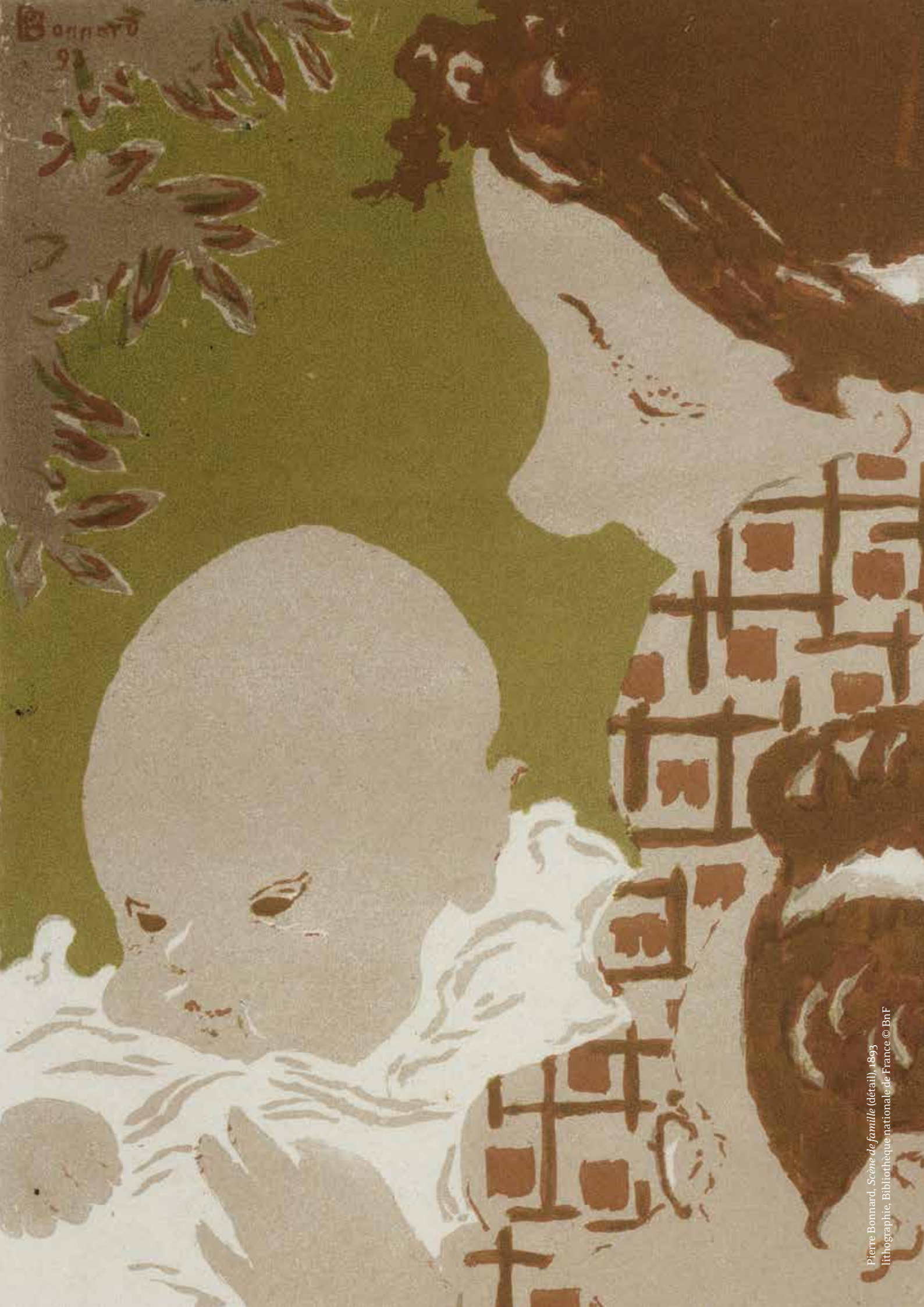
Pierre Bonnard, Scène de famille (détail) , 1893 lithographie, Bibliothèque nationale de France