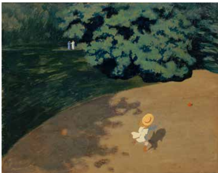
Félix Vallotton, Le Ballon , en 1899

la famille des artistes sous plusieurs générations ou les enfants se promenant (Vuillard, Au jardin , vers 1903) ou jouant (Vallotton, Le Ballon , 1899, une peinture aux cadrages audacieux et perspectives aplaties, empruntées aux estampes japonaises et surtout à la photographie qui place l'enfant dans une atmosphère douce et apaisante).