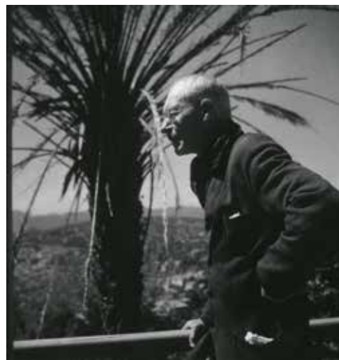
André Ostier, Portrait de Pierre Bonnard (Le Cannet), été 1942, tirage argentique d'époque