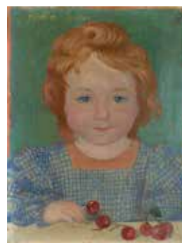
Maurice Denis, Noël aux cerises , 1899 huile sur carton Collection particulière