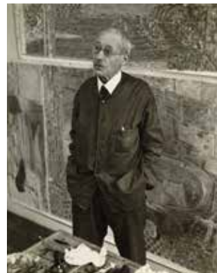
André Ostier, Pierre Bonnard dans son atelier, 1941