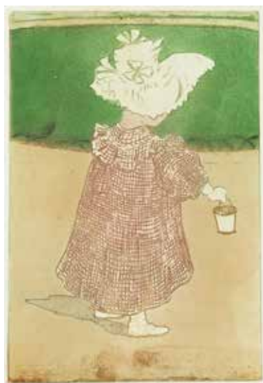
Eugène Delâtre, L'Enfant au square , 1900, lithographie Collection particulière