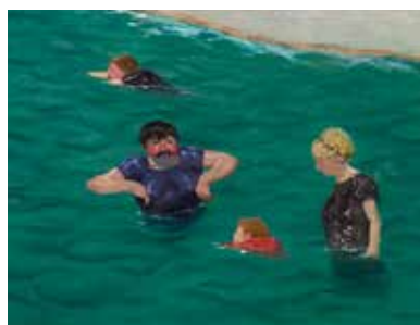
Félix Vallotton, Quatre baigneurs à Étretat , huile sur carton Galerie Bailly, Suisse