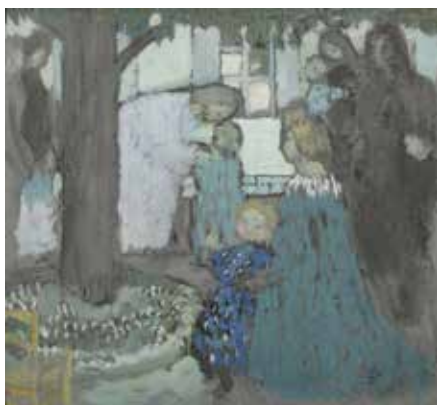
Maurice Denis, Laissez venir à moi , 1899 huile sur panneau Collection Winter

Visuels libres de droits pour la presse museebonnard.fr > Infos pratiques > Espace presse Identifiant : medialmb / Mot de passe : medialmb