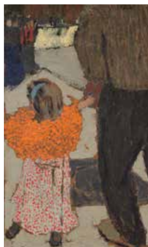
Édouard Vuillard, L'Enfant à la cape rouge , vers 1891 huile sur carton

Bibliothèque Nationale de France, Paris © BnF