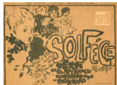
Pierre Bonnard, Petit solfège illustré, 1891-1893 32 illustrations de Pierre Bonnard 2 ex. éd. Quantin, Paris 1893