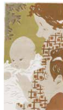
Pierre Bonnard, Scène de famille , 1893 lithographie Bibliothèque nationale de France