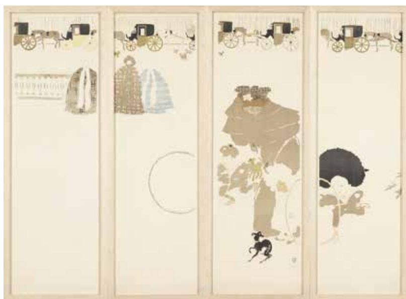
Pierre Bonnard La Promenade des nourrices. Frise de fiacres 1897, lithographie Musée Bonnard, Le Cannet Acquis avec l'aide du FRAM Concours du Ministère de la Culture et de la Communication

Par ailleurs, en abordant le thème de la vie parisienne, les Nabis ne se sont pas limités à l'aspect urbain de la ville. Les jardins apparaissent aussi comme un motif idéal dans lesquels s'harmonisent vision de la nature et vitalité du monde.