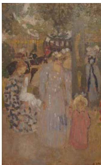
K.X. Roussel, Au jardin , 1903 huile sur panneau Collection particulière