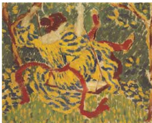
Aristide Maillol, L'Escarpolette , carton de tapisserie, 1896 Huile sur carton contrecollé sur serpillière Collection particulière