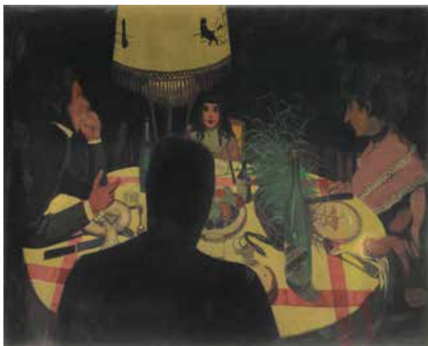
Félix Vallotton, Le Dîner, effet de lampe , 1899 huile sur carton marouflé sur bois © musée d'Orsay, Dist. RMN-Grand Palais / Patrice Schmidt

Il est alors possible de découvrir des scènes quotidiennes de toilette, de moments passés dans la chambre à coucher ou d'affection maternelle. Des moments en famille pleins de tendresse qui alternent avec des scènes illustrant les repas et goûters, les petits à leurs devoirs ou à leur leçon de solfège. En résulte de multiples portraits d'enfants attestant l'intérêt des Nabis pour ces figures au côté naturel et instinctif, non encore affectées par les affres de la vie.