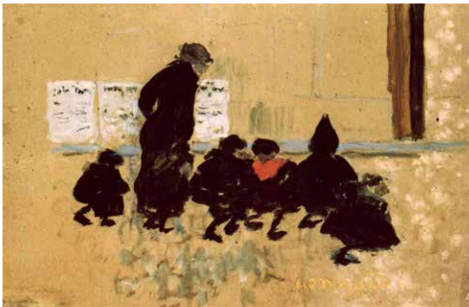
Pierre Bonnard, En route pour l'école , vers 1895 huile sur carton

Visuels libres de droits pour la presse museebonnard.fr > Infos pratiques > Espace presse Identifiant : medialmb / Mot de passe : medialmb